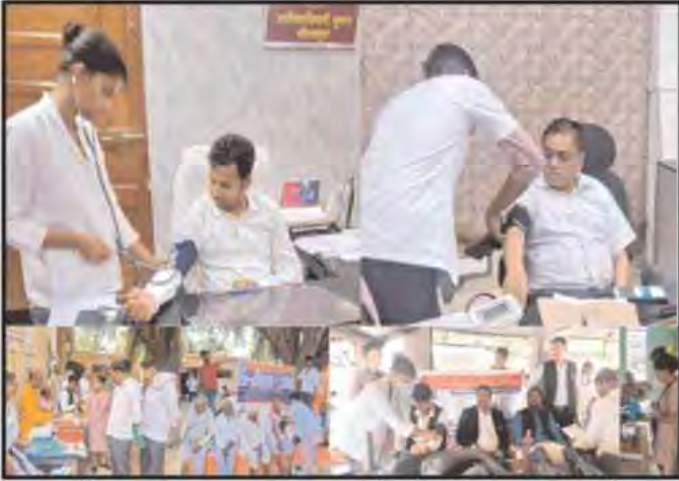
ग्रामीण सुबह- मिर्जापुर। विश्व हाइपरटेंशन दिवस के अवसर पर इस वर्ष की थीम नियमित रक्तचाप की जांच कर इसे नियंत्रित करें एवं लंबी आयु जिये पर, एपेक्स वेलकेयर

एपेक्स ट्रस्ट द्वारा आयोजित निःशुल्क शिविर मे नापा गया 629 का बीपी 0 252 मरीजो मे पाये गए हाइपरटेंशन की विभिन्न स्टेजों के लक्षण